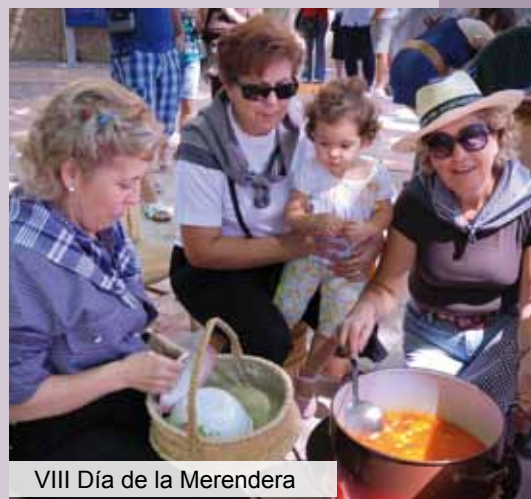
VIII Día de la Merendera