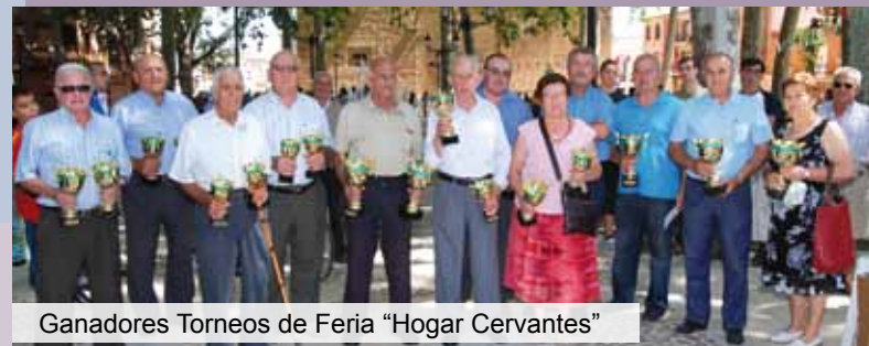
Ganadores Torneos de Feria “Hogar Cervantes”