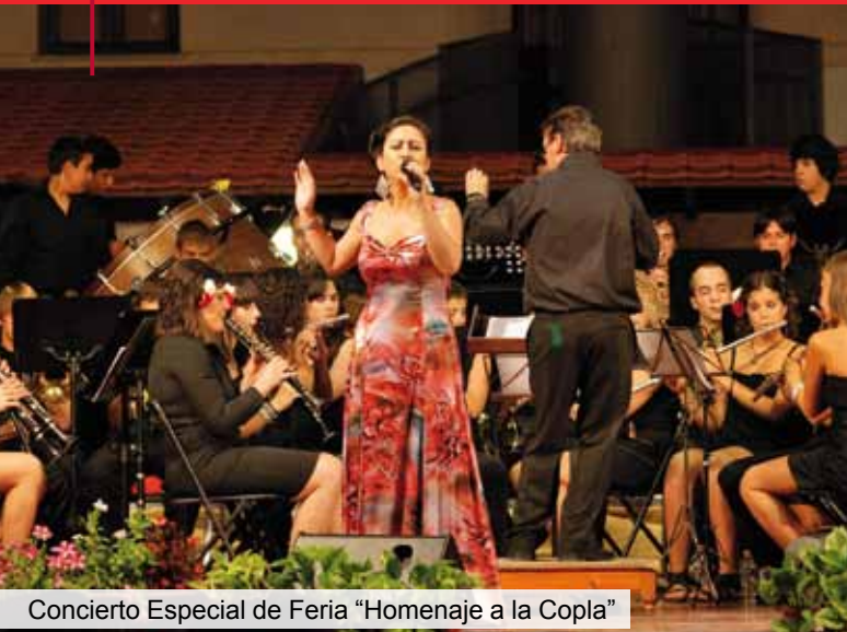
Concierto Especial de Feria "Homenaje a la Copla"