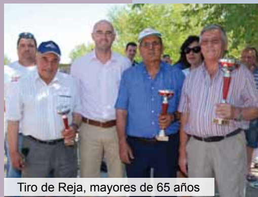
Tiro de Reja, mayores de 65 años