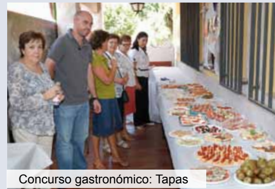
Concurso gastronómico: Tapas