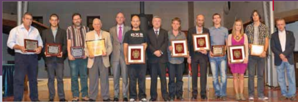
Acto Literario y entrega de Galardones de los Certámenes de Feria