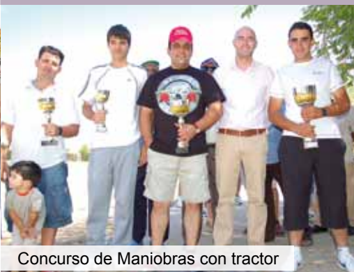
Concurso de Maniobras con tractor