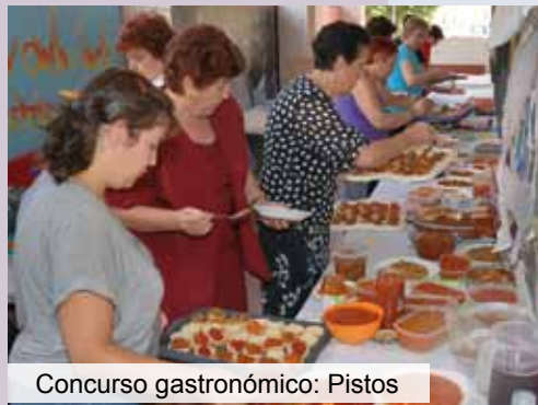
Concurso gastronómico: Pistos