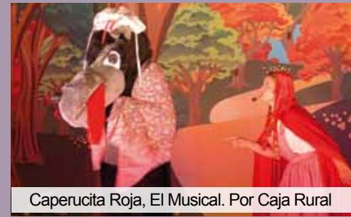
Caperucita Roja, El Musical. Por Caja Rural