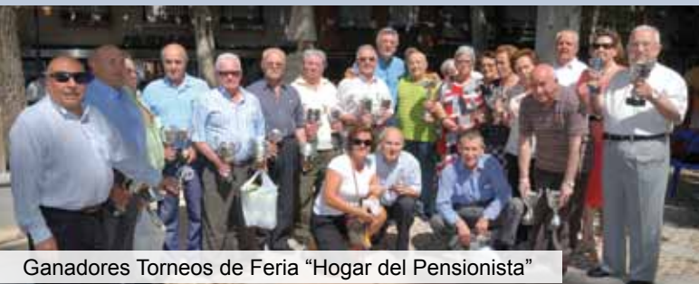
Ganadores Torneos de Feria “Hogar del Pensionista”