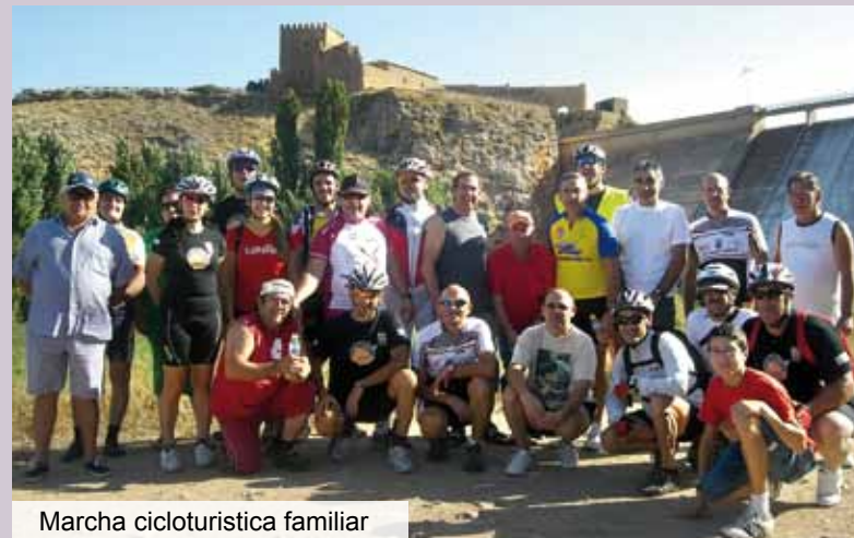
Marcha cicloturística familiar