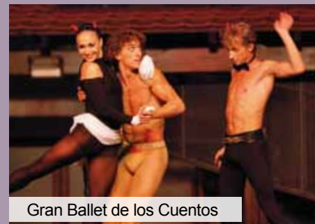
Gran Ballet de los Cuentos