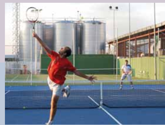
Tenis: Torneo Individual de Feria