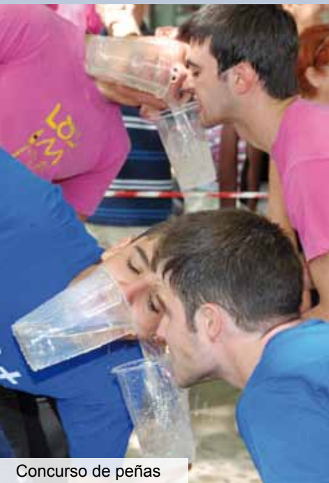
Concurso de peñas