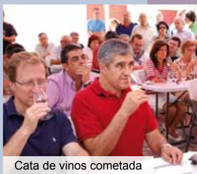
Cata de vinos cometada