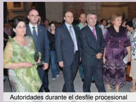
Autoridades durante el desfile procesional