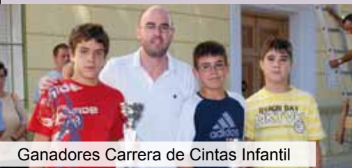
Ganadores Carrera de Cintas Infantil