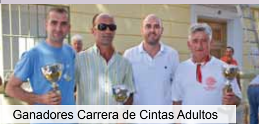
Ganadores Carrera de Cintas Adultos