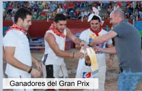
Ganadores del Gran Prix