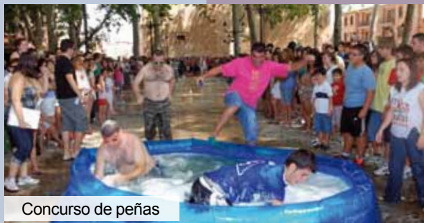
Concurso de peñas