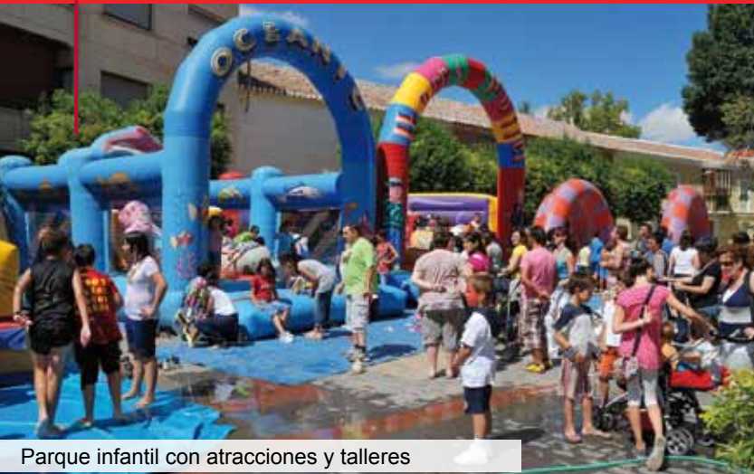
Parque infantil con atracciones y talleres