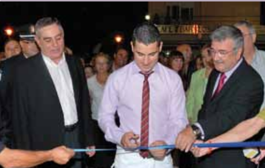
Encendido del arco luminoso y corte de cinta