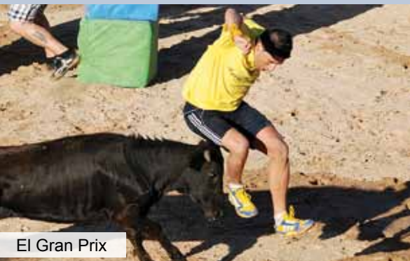
El Gran Prix