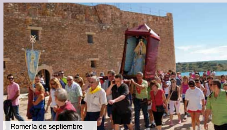
Romería de septiembre