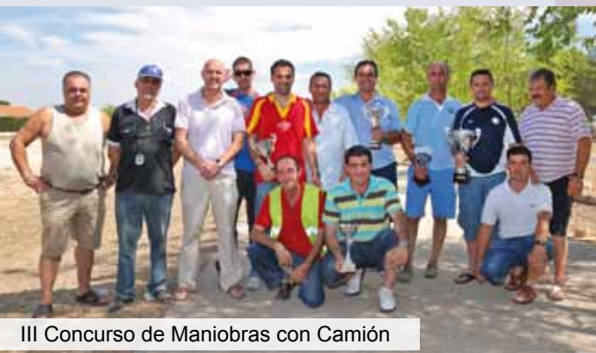
III Concurso de Maniobras con Camión