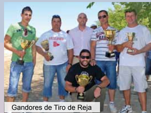
Gandores de Tiro de Reja