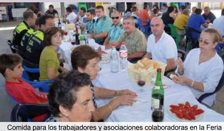
Comida para los trabajadores y asociaciones colaboradoras en la Feria