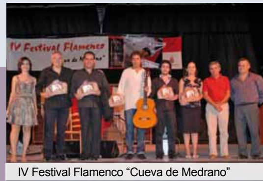
IV Festival Flamenco "Cueva de Medrano"