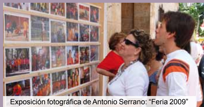
Exposición fotográfica de Antonio Serrano: "Feria 2009"