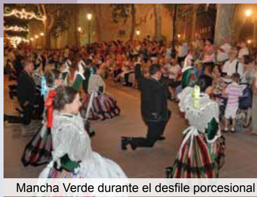
Mancha Verde durante el desfile procesional