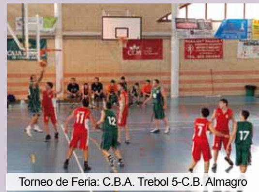
Torneo de Feria: C.B.A. Trebol 5-C.B. Almagro