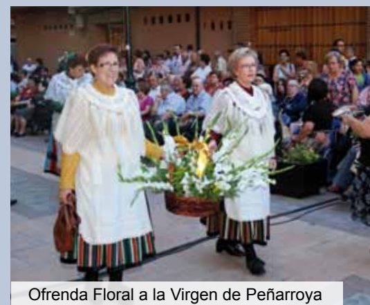
Ofrenda Floral a la Virgen de Peñarroya