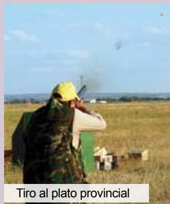
Tiro al plato provincial