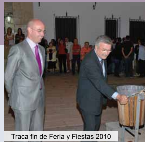
Traca fin de Feria y Fiestas 2010