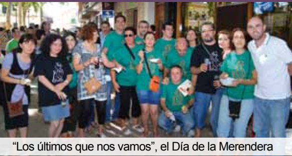
“Los últimos que nos vamos”, el Día de la Merendera