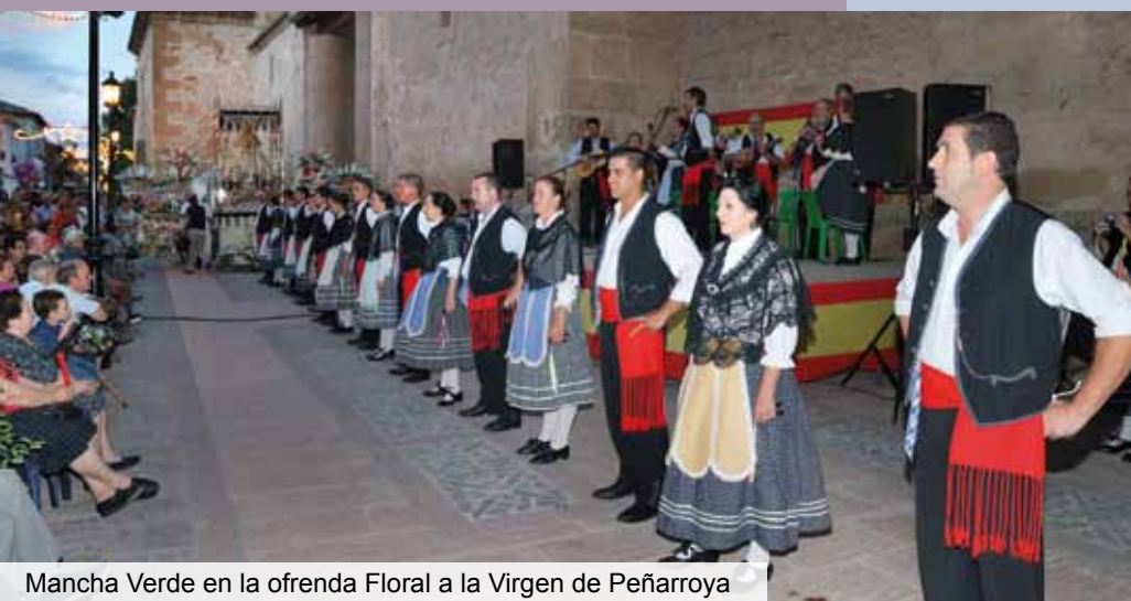
Mancha Verde en la ofrenda Floral a la Virgen de Peñarroya