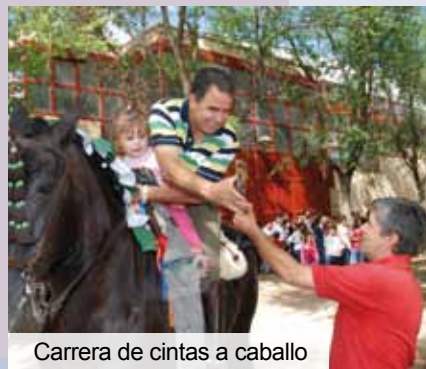
Carrera de cintas a caballo