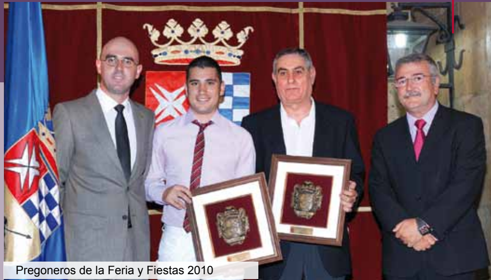
Pregoneros de la Feria y Fiestas 2010