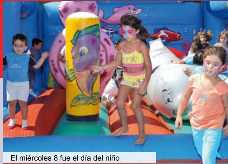
El miércoles 8 fue el día del niño