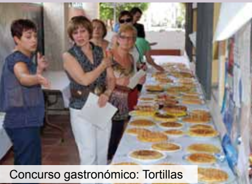
Concurso gastronómico: Tortillas