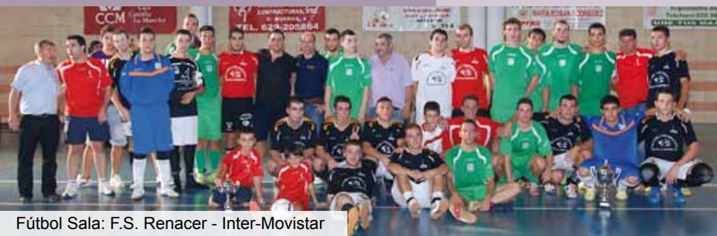
Fútbol Sala: F.S. Renacer - Inter-Movistar