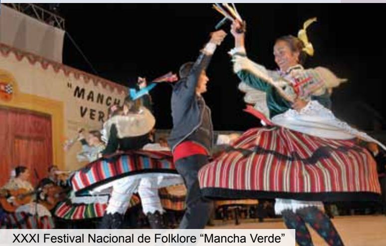
XXXI Festival Nacional de Folklore "Mancha Verde"