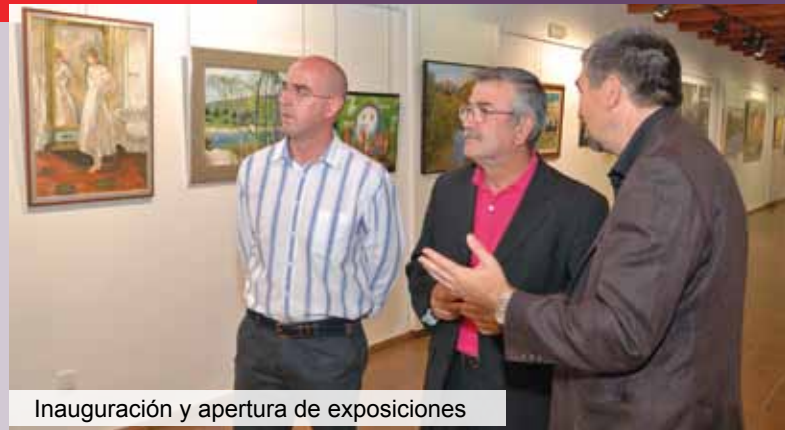
Inauguración y apertura de exposiciones