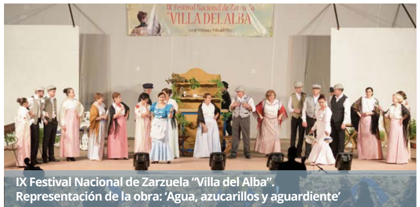
IX Festival Nacional de Zarzuela "Villa del Alba". Representación de la obra: 'Agua, azucarillos y aguardiente'