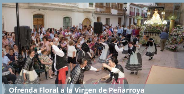
Ofrenda Floral a la Virgen de Peñarroya