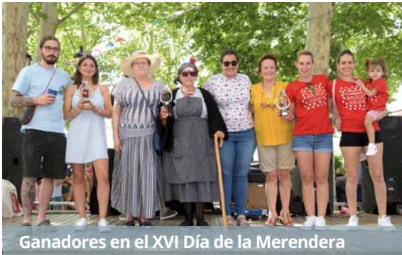
Ganadores en el XVI Día de la Merendera