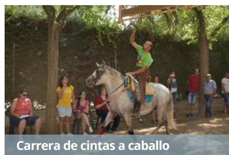
Carrera de cintas a caballo