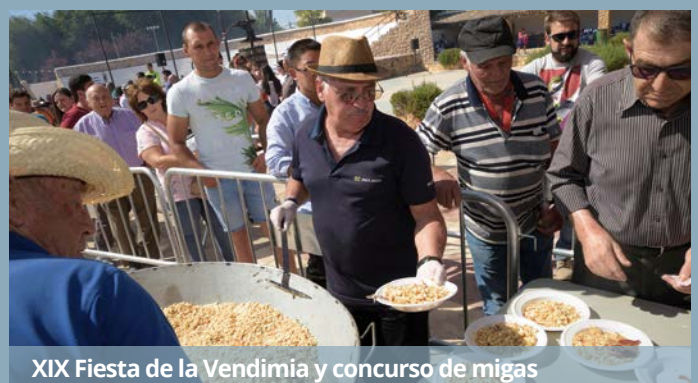
XIX Fiesta de la Vendimia y concurso de migas