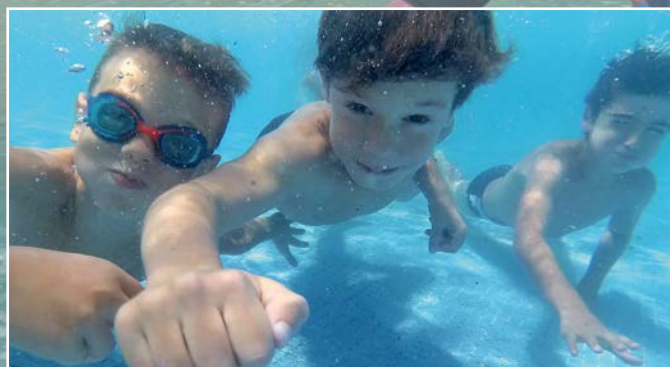
El área de Juventud cerró un intenso verano lleno de actividades