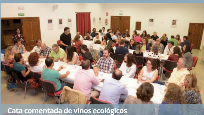
Cata comentada de vinos ecológicos