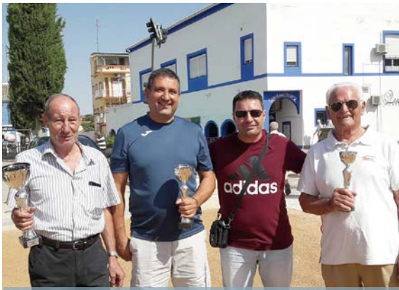
Ganadores Torneo de Feria de Petanca