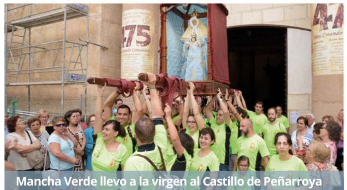
Mancha Verde llevo a la virgen al Castillo de Peñarroya