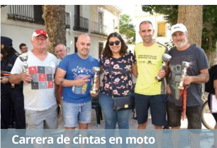
Carrera de cintas en moto