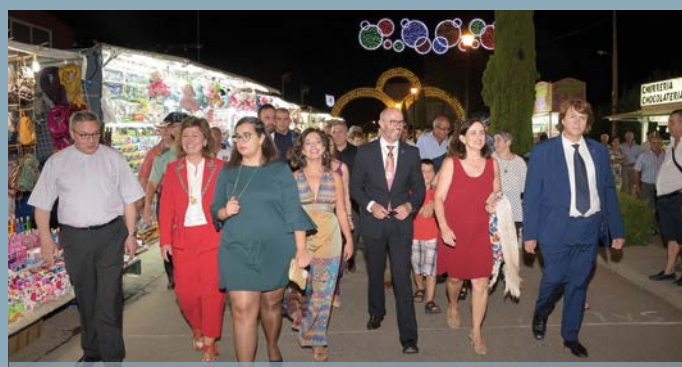
Apertura oficial del Recinto Ferial.