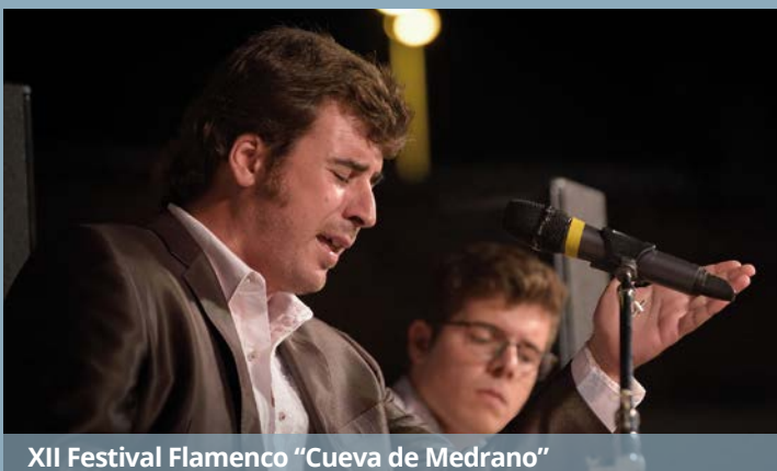
XII Festival Flamenco "Cueva de Medrano"