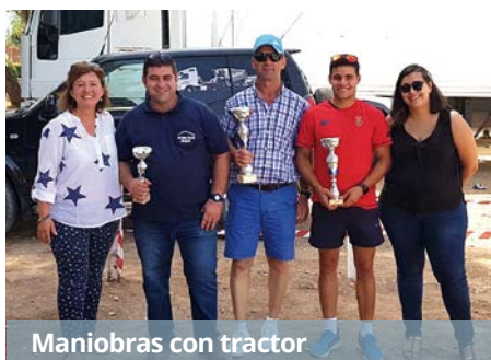
Maniobras con tractor