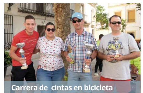
Carrera de cintas en bicicleta