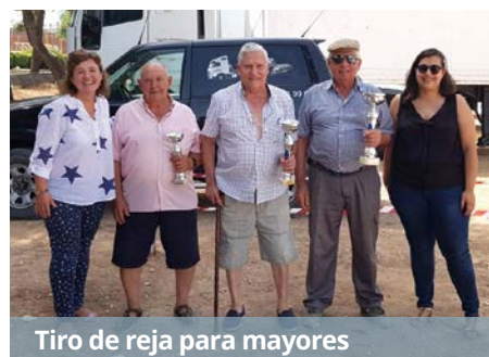
Tiro de reja para mayores