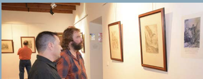
Exposición de grabados del Quijote de Gustave Doré y "Don Quijote visto por Ludel".