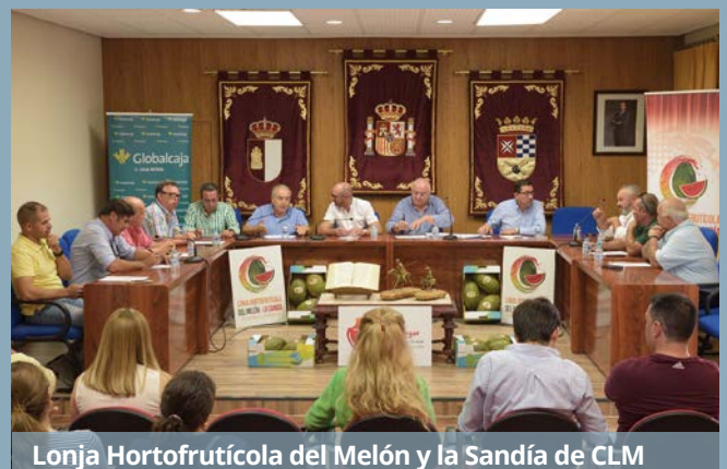
Lonja Hortofrutícola del Melón y la Sandía de CLM