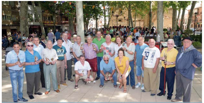
Ganadores torneos de Feria Hogar del Pensionista