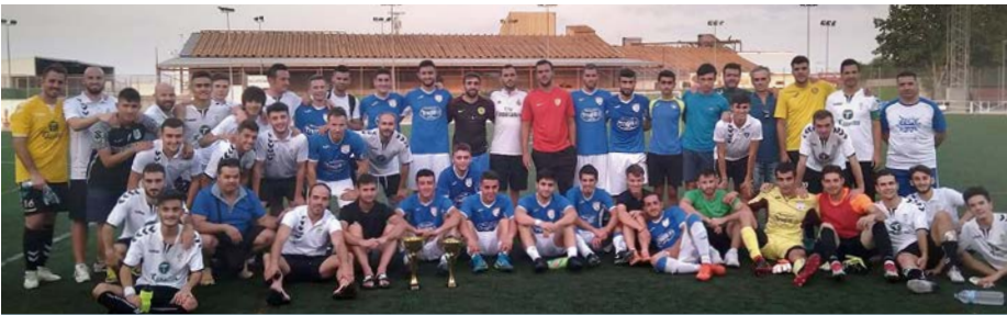
Atlético Cervantino - Herencia