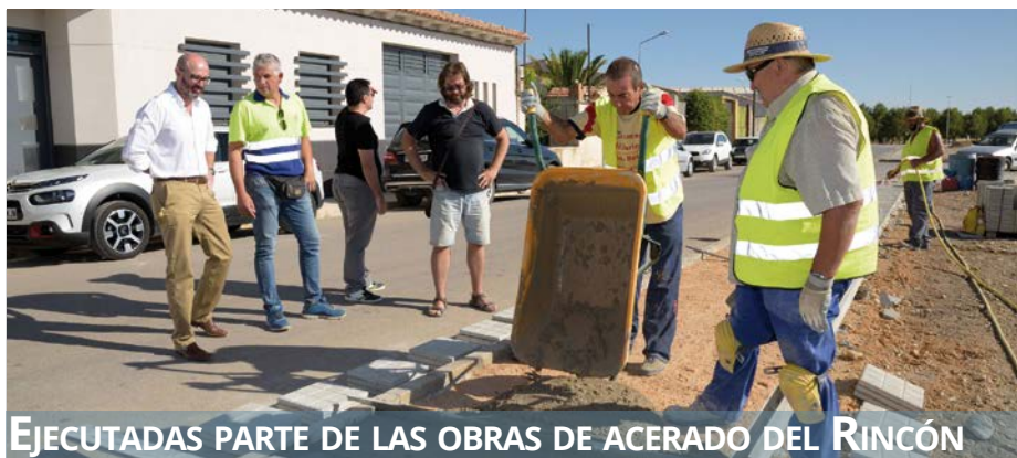
EJECUTADAS PARTE DE LAS OBRAS DE ACERADO DEL RINCÓN

Con esta vía verde, se recupera para el esparcimiento y disfrute de todo los argamasilleros y argamasilleras la zona norte de la localidad y la plataforma del antiguo ferrocarril, además de facilitar un camino alternativo a los jóvenes y usuarios que se desplazan en bicicleta a las instalaciones deportivas, situadas en el entorno del recinto ferial, evitando los riesgos de circular por la N-310.