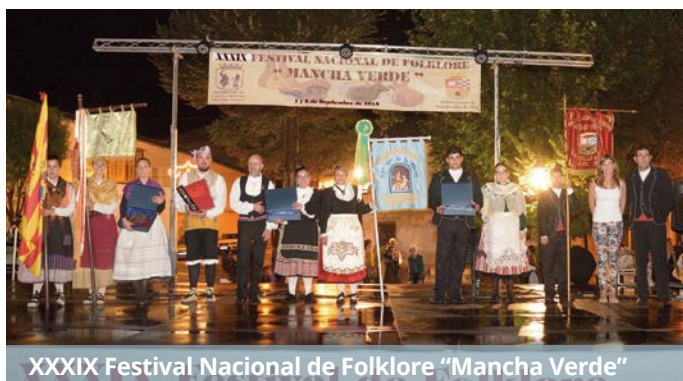
XXXIX Festival Nacional de Folklore "Mancha Verde"

Más información en: www.argamasilladealba.es