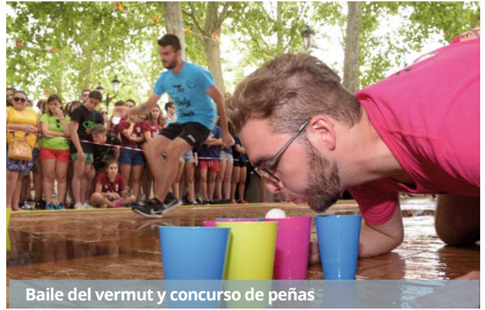
Baile del vermut y concurso de peñas