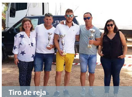
Tiro de reja