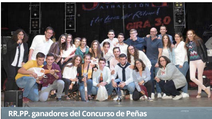
RR.PP. ganadores del Concurso de Peñas