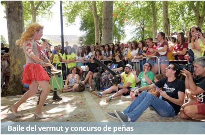
Baile del vermut y concurso de peñas