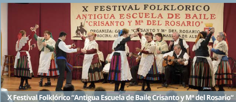
X Festival Folklórico "Antigua Escuela de Baile Crisanto y Mª del Rosario"