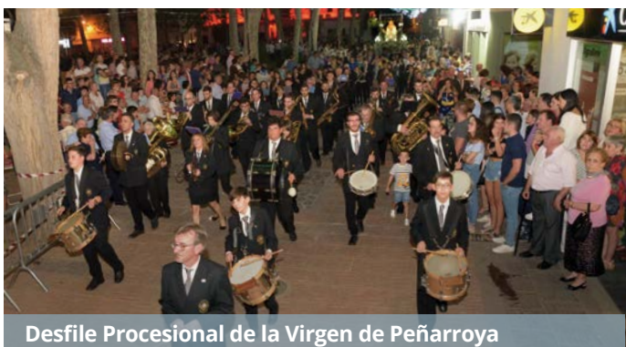
Desfile Procesional de la Virgen de Peñarroya